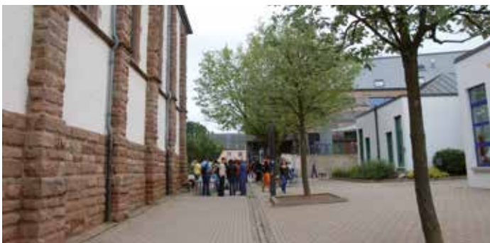
Atelië fir all Kand