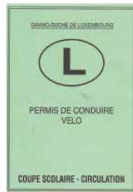
Le permis vélo

T ous les deux ans, les élèves du cycle 4 participent à la coupe scolaire organisée par les enseignants responsables, en collaboration avec la sécurité routière et avec l'aide de bénévoles. Les épreuves pratiques sont précédées des épreuves théoriques.