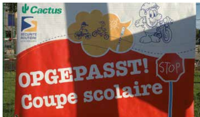
Le parcours dans la circulation réelle