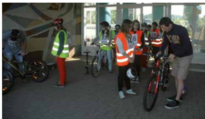
Le service technique