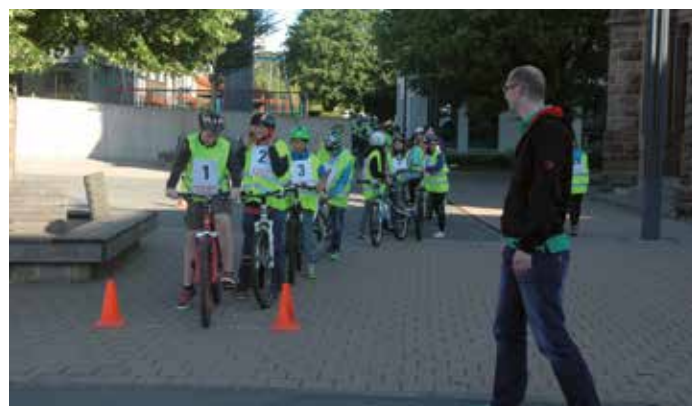
Le parcours de la maniabilité