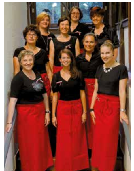
Museksfest Bella Italia