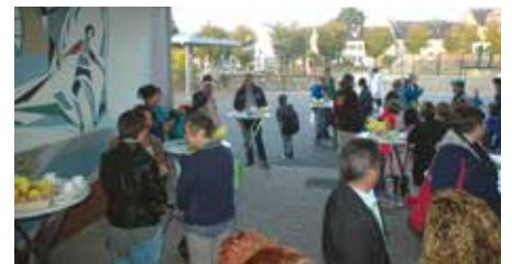
... et quelques-uns des invités