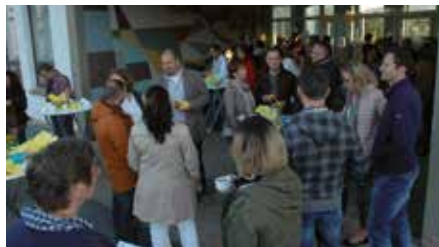
La communauté scolaire