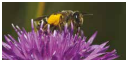
Honigbiene mit vollem Pollenkörbchen

Seit einigen Jahren beschäftigt das Thema "Bienensterben" die Öffentlichkeit und fördert ganz unterschiedliche Meinungen zutage. Ohne Zweifel spielt die Honigbiene als Bestäuber und Honiglieferrant eine sehr wichtige Rolle für die Menschheit. Schon Einstein machte sich dazu seine Gedanken: "Wenn die Biene einmal von der Erde verschwindet, hat der Mensch nur noch vier Jahre zu leben". Heute wissen wir, dass das so nicht ganz stimmt, und doch würde es uns teuer zu stehen kommen, würden die Bienen aussterben. So wird ihr Wert in der Lebensmittelproduktion weltweit auf rund 153 Milliarden Euro pro Jahr geschätzt. Diese Kosten belaufen sich hauptsächlich auf die Handbestäubung mit Pinsel von Menschenhand, wie sie schon in manchen Gegenden Chinas angewendet werden muss, wo durch übermäßigen Pestizideinsatz bereits jegliche Nützlinge verschwunden sind. Den Bestäubern haben wir es also zu verdanken, dass wir jeden Tag frisches Gemüse und Obst zu einem vernünftigen Preis genießen können.