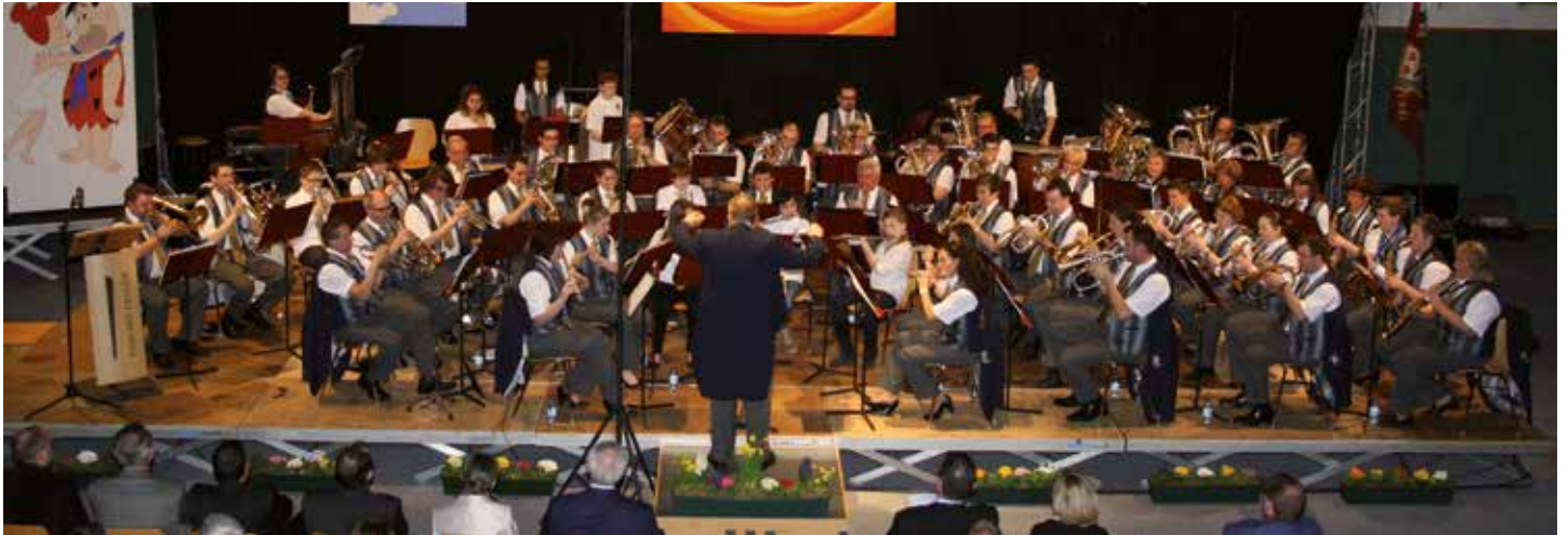
Gala Concert 2014