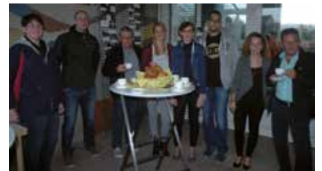
Quelques représentants du corps enseignant et éducatif ...