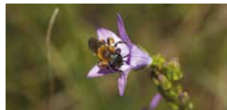
Glockenblumen-Arten sind ein sehr wichtiger Pollenlieferant für viele unserer Wildbienen.

Eine Anleitung zum Bau eines Bienenhotels sowie eine Liste mit Gartenpflanzen für Wildbienen können Sie unter www.sicona.lu abrufen oder bei uns anfordern (unter Tel. 26 30 26 - 25 oder administration@sicona.lu ). Für weitere Fragen können Sie sich gerne an folgende Adresse wenden: