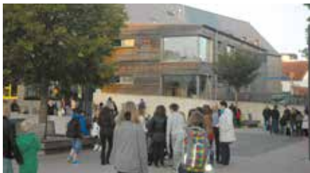
Lundi, le 15 septembre 2014

C e rendez-vous traditionnel le jour de la rentrée des classes est organisé par les représentants des parents et offert par la commune de Feulen. La communauté scolaire s'y rencontre afin d'entamer ensemble la nouvelle année scolaire.