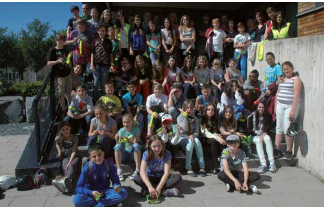
Les cyclistes "avoués"

T ous les deux ans, les élèves du cycle 4 participent à la coupe scolaire organisée par les enseignants responsables, en collaboration avec la sécurité routière et avec l'aide de bénévoles. Les épreuves pratiques sont précédées des épreuves théoriques.