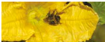
Eine Erdhummel, von Pollen überzogen

hen, dass die Honigbiene die wichtigste Rolle als Bestäuber hat.