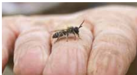
Anders als die Honigbiene haben Wildbienen kein Volk zu verteidigen und sind deshalb nicht stechlustig

Das Sterben von Honigbienenenvölkern ist also nicht das einzige Problem, auch wenn es uns persönlich am meisten trifft. Auch viele Wildbienenarten haben - von uns unbemerkt - mit einem starken Rückgang zu kämpfen. Sie leiden unter den gleichen Problemen wie die Honigbiene: einem Mangel an jederzeit verfügbarer, ungiftiger (also von Pestiziden unbelasteter) Nahrung.