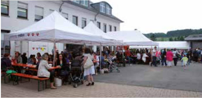
Mëttegiessen fir Grouss a Kleng