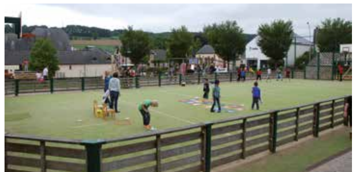
Spill a Spaass