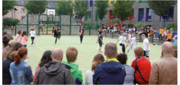
Leschten Optrëtt vum Cycle 4.2