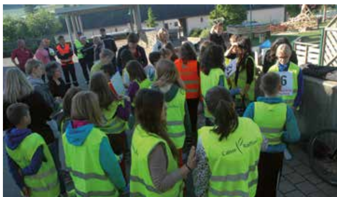
La répartition des dossards