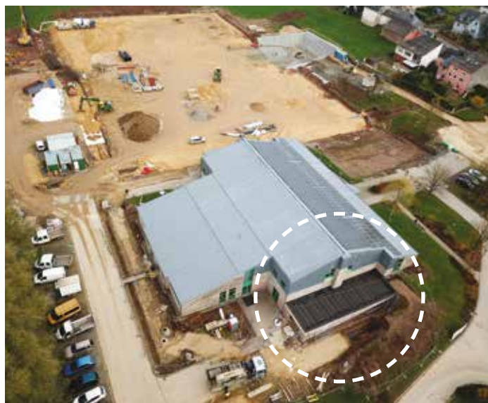
Ubau un d'Sportshal Construction d'une annexe au hall sportif