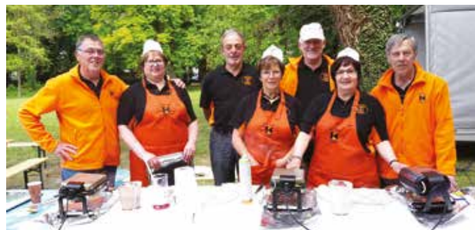
D'Equipe vum Kolping Feelen beim Eisekuchebaken am Park zu Mæertert