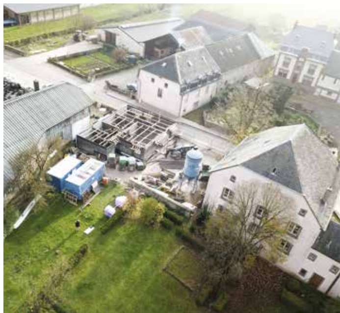
Bau vu Sozialwunnengen zu Uewerfeelen Construction de logements sociaux à Oberfeulen