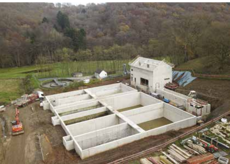
Vergréisserung a Moderniséierung vun der interkommunaler biologescher Kläranlag Agrandissement et modernisation de la station d'épuration biologique intercommunale