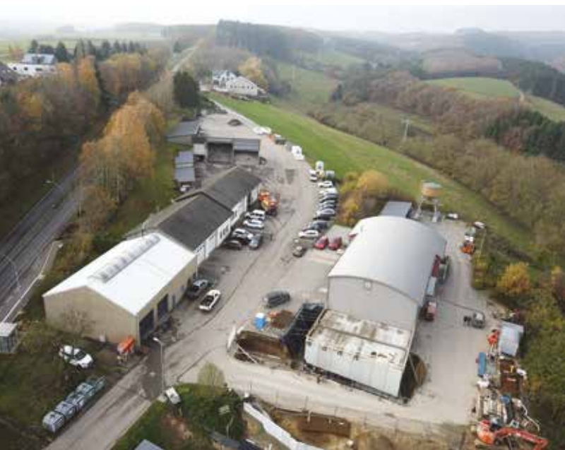
Vergréisserung vum Gemengenatelier Construction d'une dépendance pour l'atelier Communal